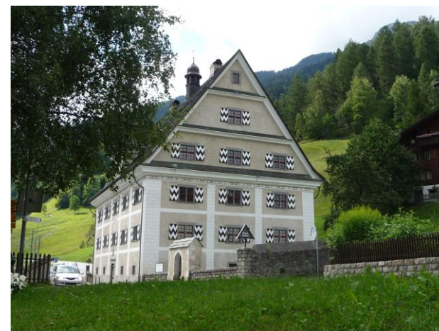
Museum Sursilvan Cuort Ligia Grischa Trun