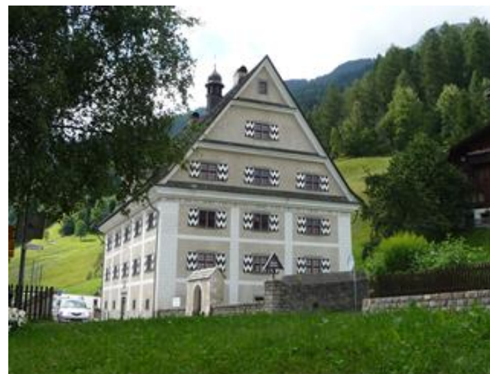
Museum Sursilvan Cuort Ligia Grischa Trun