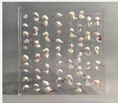
Art textil Shades of Memory